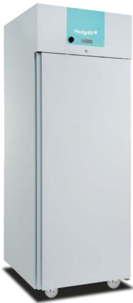
MLRA 700 S