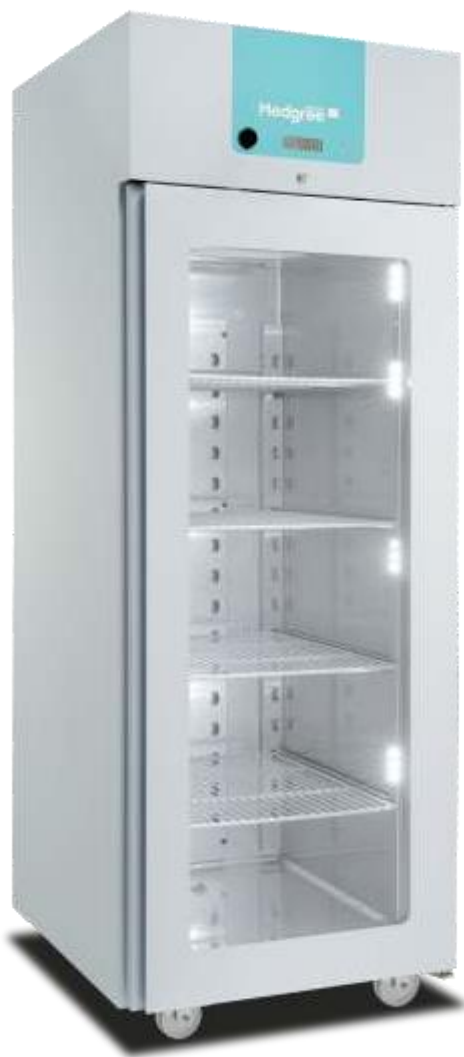
MLRA 700 G